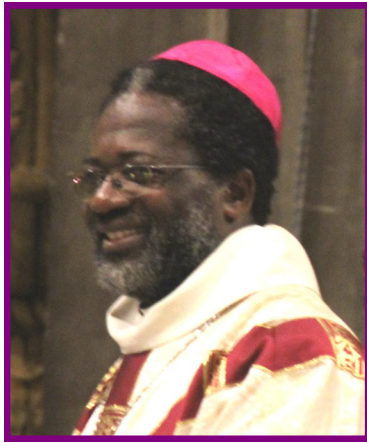
Mgr Ambassa

Homélie de Mgr Faustin Ambassa Ndjodo Archevêque de Garoua (Cameroun)