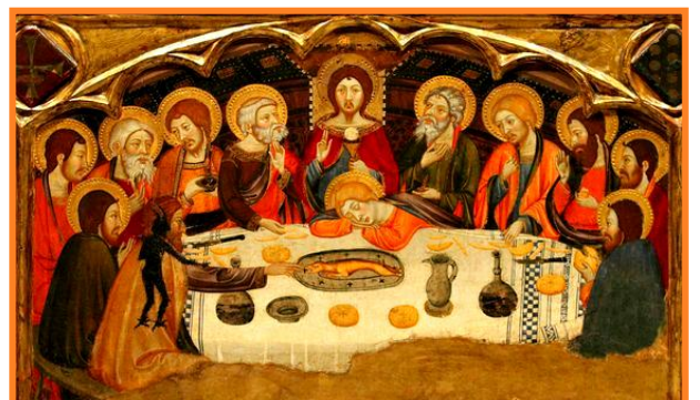
© Jaume Serra. Retable de la Mère de Dieu. 1367-81

Prière. Célébrant Seigneur Jésus-Christ, dans cet admirable sacrement, tu nous as laissé le mémorial de ta passion ; donne-nous de vénérer d'un si grand amour les mystères de ton corps et de ton sang, que