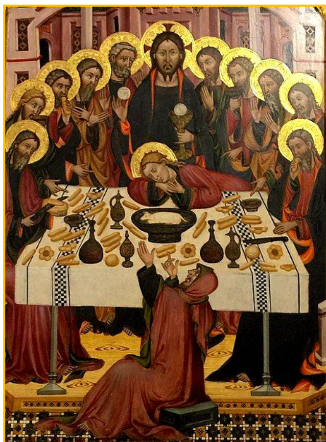
Peinture de Llorenç Saragossà (14 e siècle) Église de la Nativité de la Vierge Marie, Villahermosa del Rio (Espagne) Wikimedia commons

TRÈS SAINTE TRINITÉ , Père, Fils et Saint-Esprit, je vous adore profondément et je vous offre le très précieux Corps, Sang, Âme et Divinité de Notre Seigneur Jésus-Christ présent dans tous les tabernacles du monde, en réparation des outrages, sacrilèges et indifférences par lesquels il est lui-même offensé. Par les mérites infinis de son Très Saint-Cœur et du Cœur Immaculé de Marie, je vous demande la conversion des pauvres pécheurs.